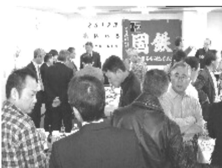
名古屋地本の旗のもとで語らう参加者

組合員も多数参加し、それぞれの想いを語りあう場となった。村上鉄道フォーラム代表は、これまでの闘いをねぎらうとともに、自らの高教組時代の職場の活動の困難にふれながら思いが語られ、多くの方からの国労への期待、激励と連帯の気持ちが伝わる旗開きであった。