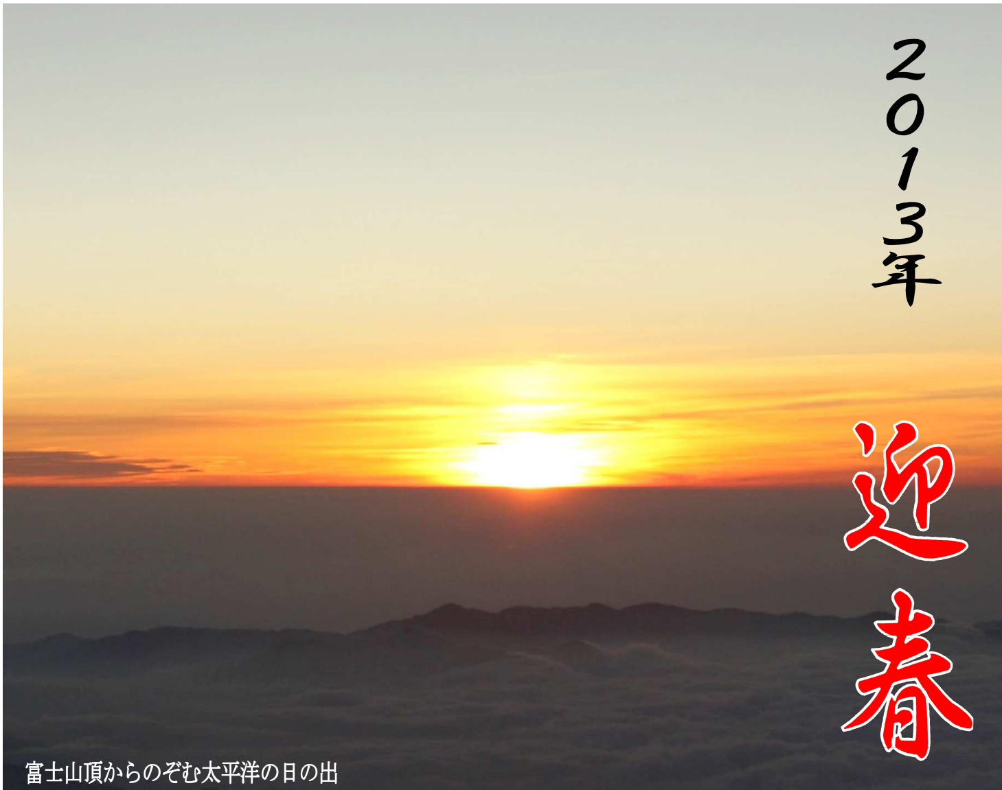
富士山頂からのぞむ太平洋の日の出