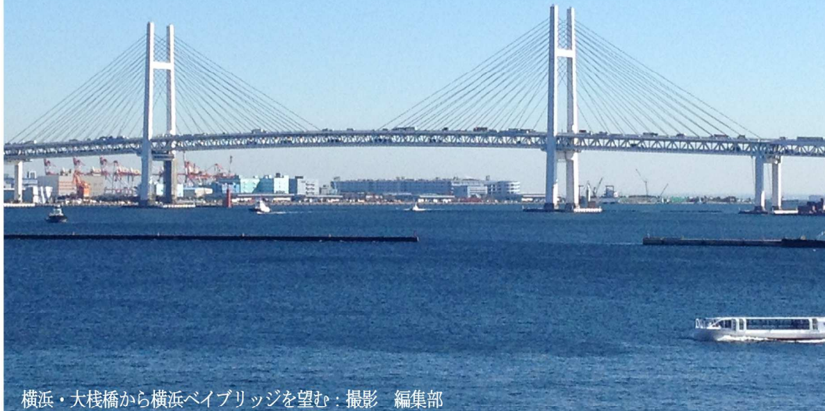
横浜・大榎橋から横浜ベイブリッジを望む。