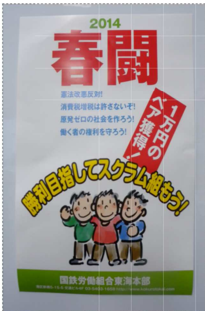
東海本部作成の「2014春闘ポスター」