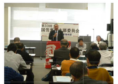
(上)東海本部委員会で発言する委員(下)発言を受けて集約する上野書記長

など、15項目の要求をJR東海会社に申入れ、2月27日現在、4回の交渉を重ねています(詳細は交渉情報等参照)。ベア要求については、主に「賃金・生活実態調査(賃金アンケート)」を基にして、「毎月赤字がある」組合員が57%、その平均金額が4万円を超え、赤字の補填には期末手当と預貯金の取崩しが大半を占める等、組合員の賃上げを求める切実な生活実態を示し、さらに、4月からの消費税増税をはじめ様々な値上げが控えていることで今春闘での賃金引上げに組合員・社員が期待していることを強調しています。 「夏季手当3・2カ月要求」では、ベア要求と同様に、生活費の赤字補填には、期末手当と預貯金の取崩しが大きな比重を占めていることや、消費税増税