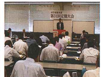
大会で挨拶を行う長岡委員長

車内改札での割引切符での資格確認で確認できない時は、一旦払い戻ししてもらい、割引無の正規料金で再度購入してもらうので、車掌・駅でトラブルの基となっている。往きの車掌と帰りの車掌で対応が違うとの苦情も出されている。国会議員