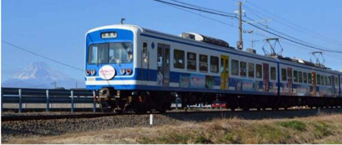
伊豆箱根鉄道 伊豆長岡～田京間から富士山を望む (2017年12月24日撮影 編集部)