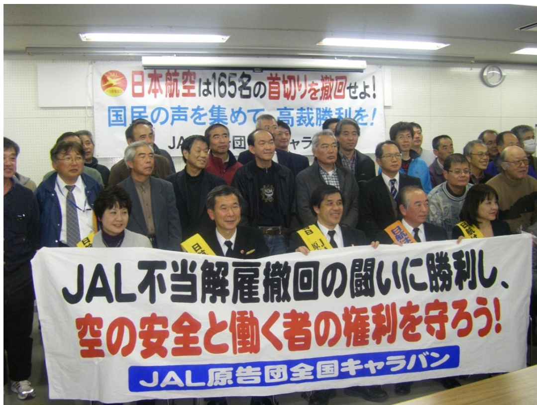
静岡集会参加者集合写真