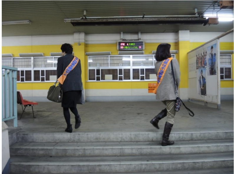
左右分かれてのオルグ?