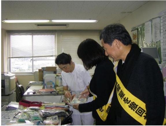
富士宮市立病院労組