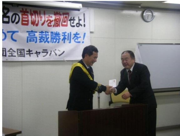
国労静岡地本で「干し椎茸」販売を取り組み、売り上げをカンパしました。