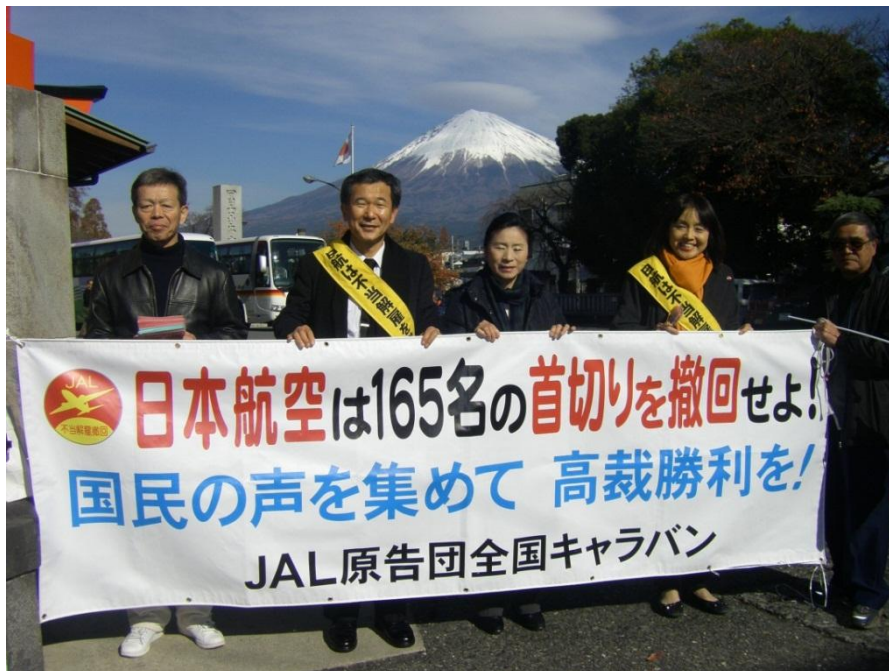
富士宮浅間大社での宣伝行動

快晴の下、富士山がきれいでした。富士山にも高裁勝利を誓いました。 解雇問題で闘っている富士急石川タクシー労組の仲間も駆けつけてくれました。