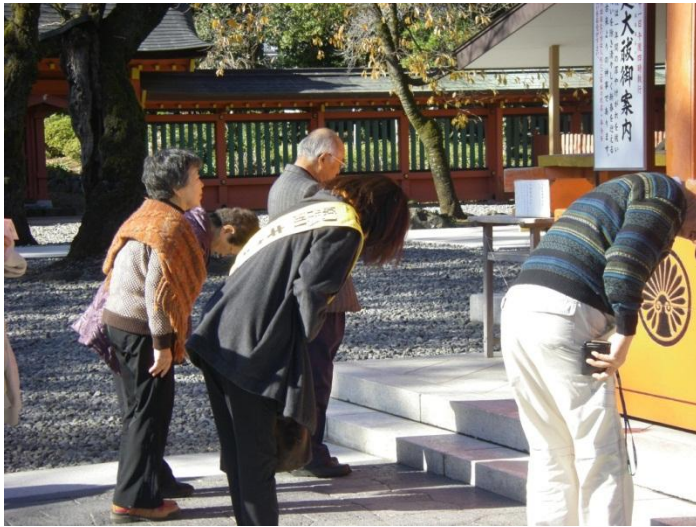
富士宮浅間神社で『勝利祈願』