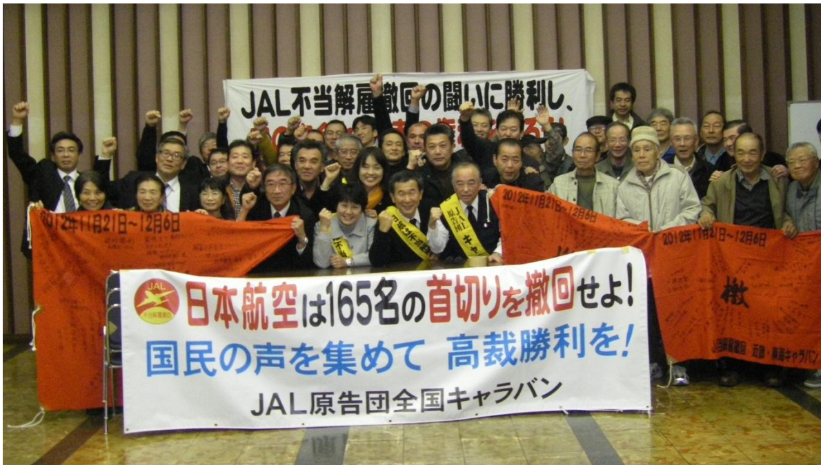
沼津集会参加者集合写真