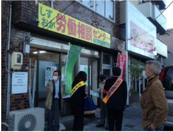
しずおか労働センター