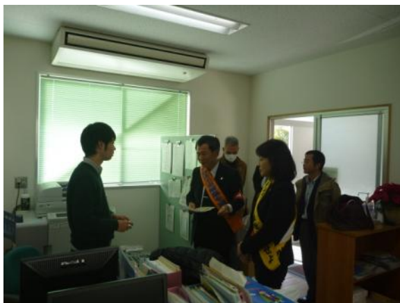
静岡県立病院労組

静岡県評・自治労連県本部・平和センター・自治労静岡県職員組合・静岡鉄道労組・ ジャストライン労組・全建総連（留守）・静岡県立病院労組・生協しずおか労組・静 岡県商工団体連合会・建交労・しずおか労働センター（県共闘他4団体）・静岡市教 職員組合・全教静岡