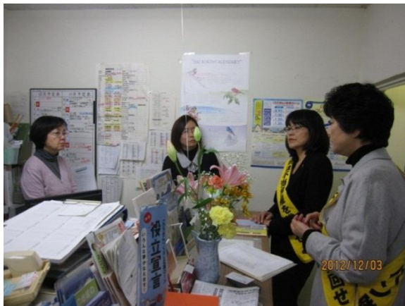
聖隷福祉事業団労組住吉支部