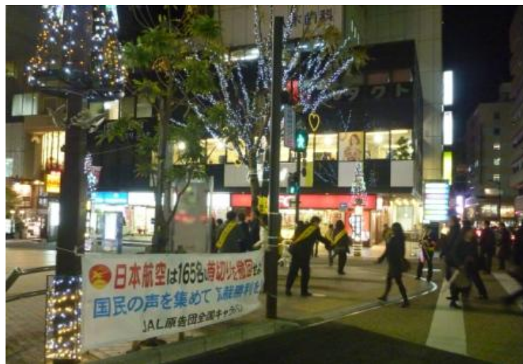
静岡繁華街での宣伝行動 寒い中、署名も頂きました！