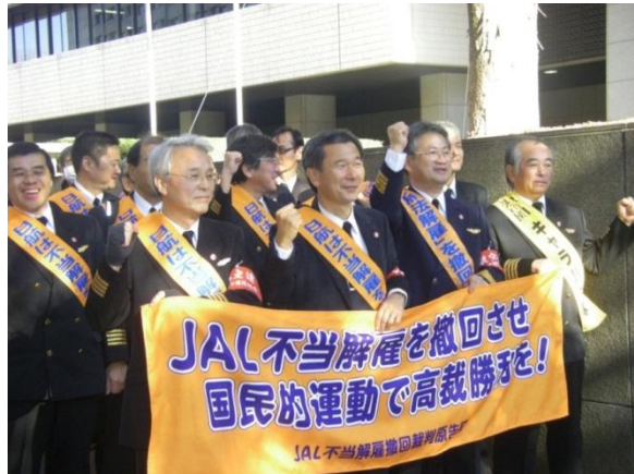
東京高裁に入廷する高裁乗員原告団