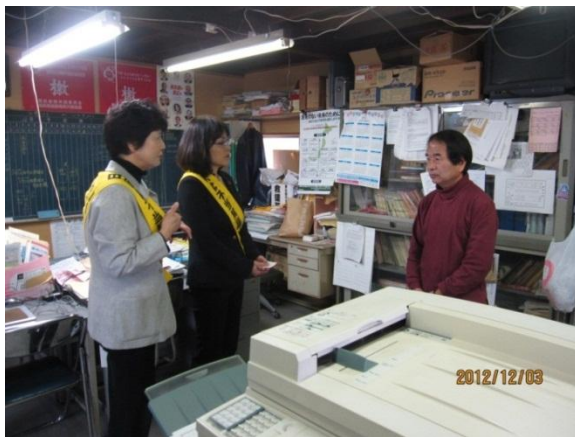
J M I U河合労組連合支部

J M I U河合連合支部・浜松市職員組合・聖隷福祉事業団労働組合住吉支部・静岡県西部地区労働組合連合会