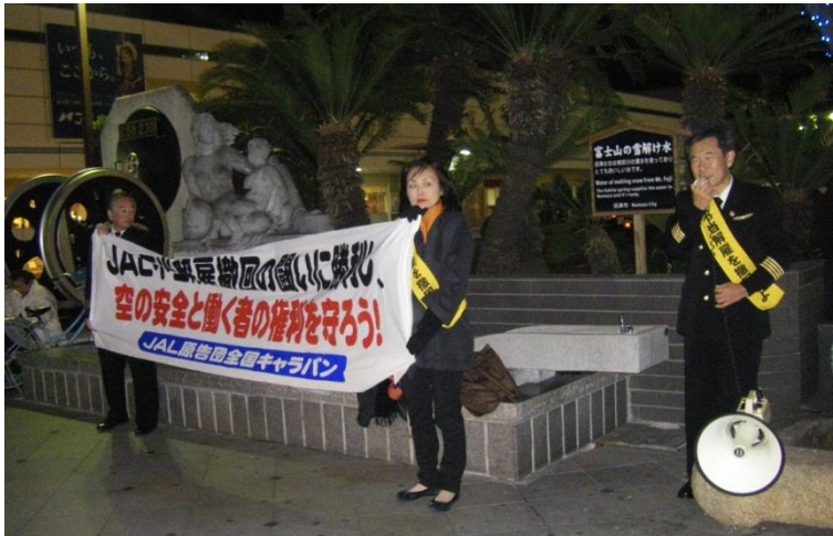
沼津駅前宣伝行動