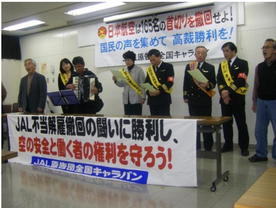
『あの空に帰ろう』を全員で歌い集会を終了しました。