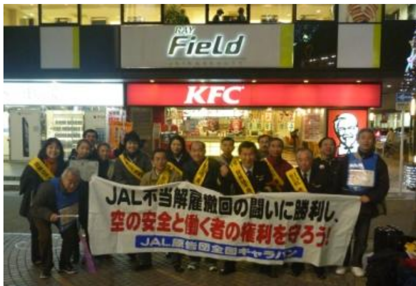
静岡繁華街宣伝行動参加の皆さん