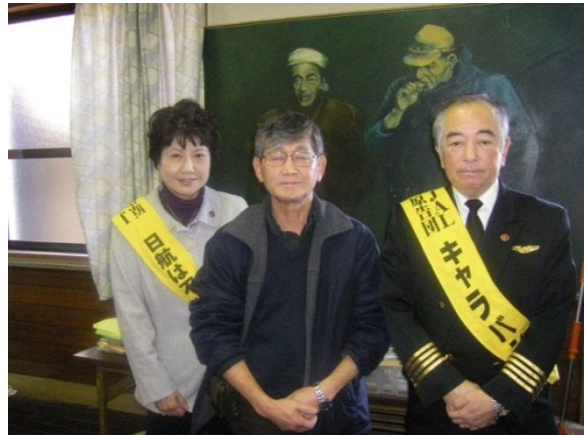
静岡金属一般本部