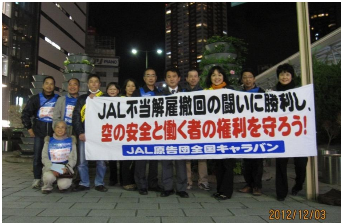
浜松駅頭宣伝行動参加の皆さん