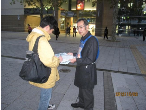
浜松駅前宣伝 《署名も頂きました》