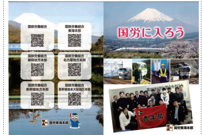
国労加入を呼びかけるパンフレット

を支援地球環境問題やトラック ドライバの不足問題等により 大量輸送の利点を生かしながら 重要な役割を果たしています。 そして、JR関連会社はJR各 社の経営に欠かせない役割を果 たしています。