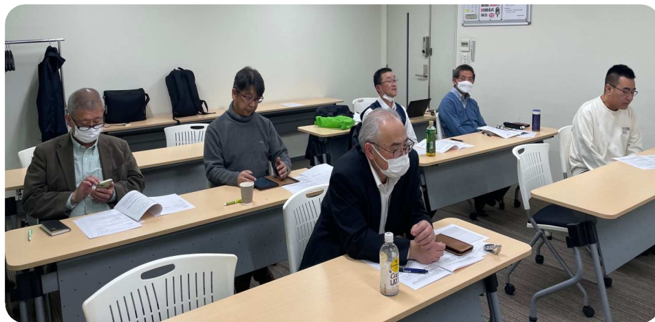
組織拡大対策会議に結集した仲間の皆さん

十二月十七日、国労東海本部は「第二回、国労東海本部・組織拡大対策会議」を開催しました。喫緊の課題である組織強化・拡大について全組合員が全力を挙げるとともに、今後は情報共有アプリやウェブツール、メールなどを幅広く活用し、職場・出向先の組合員と情報共有し、要求収集などを行い、粘り強く運動を展開し、組織強化拡大につなげていきたいと考えています。 (482号は1面のみです)